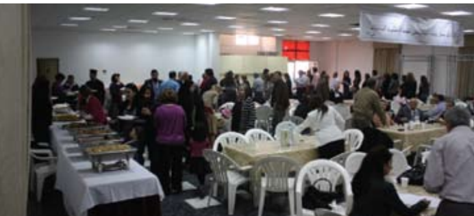
غداء خيرى - لجنة السيدات - رعية الكويت