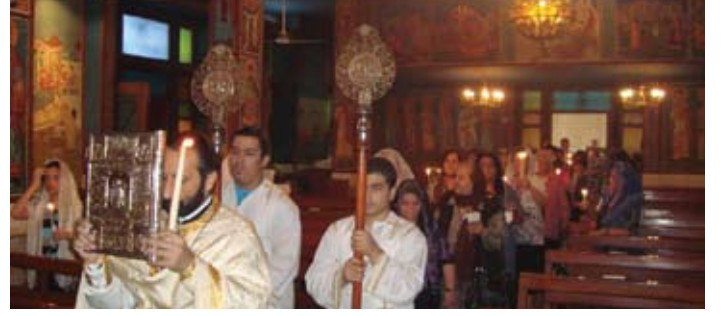
عيد الفصح - رعية العراق