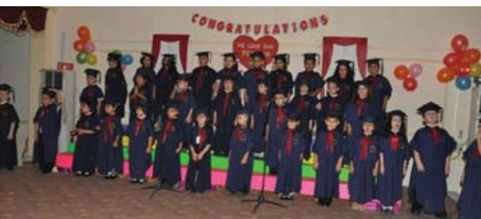
تخرج طلاب مدرسة الفرح الأهلية المختلطة - العراق