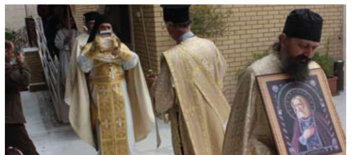
استقبال رفات القديس سيرافيم ساروف - رعية الكويت