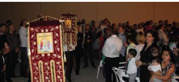
الأسبوع العظيم المقدس - رعية أبو ظبي