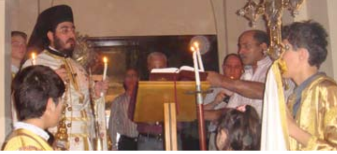
عيد الفصح المجيد - رعية سلطنة عُمان