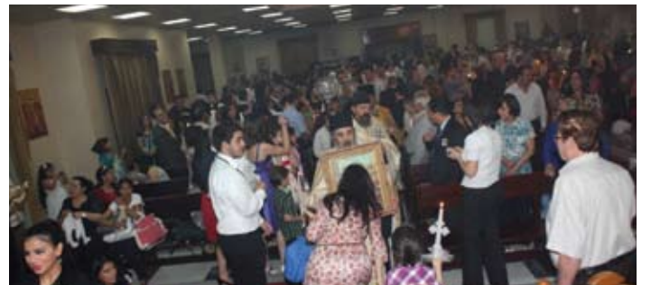
أحد الشعانين - رعية الكويت