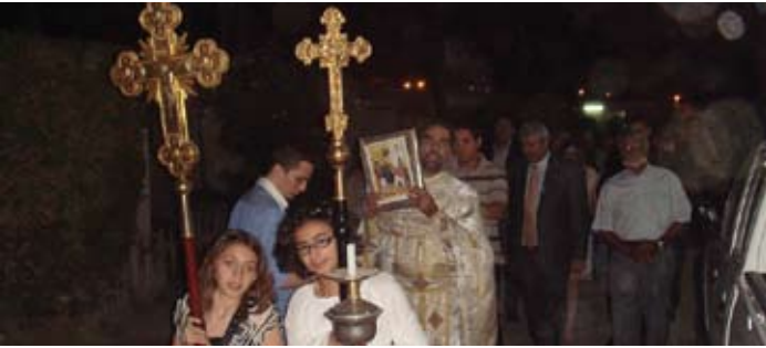
أحد الشعانين - رعية البحرين