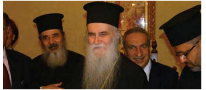
عيد القديسين قسطنطين وهيلانة - رعية الكويت