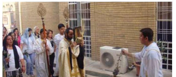
أحد الشعانين - رعية العراق